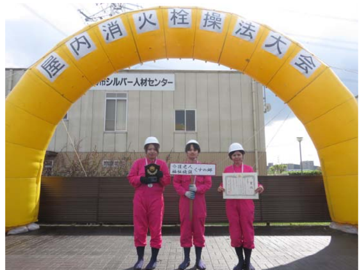
準優勝 介護老人保健施設 くすの郷