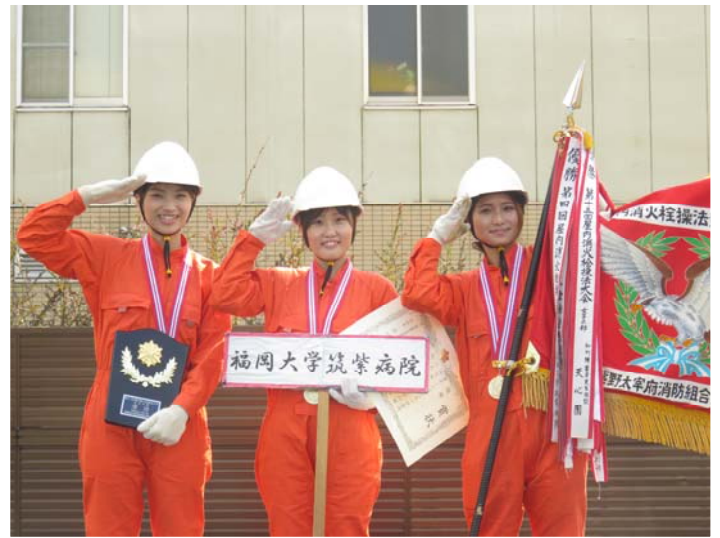
優勝 福岡大学筑紫病院