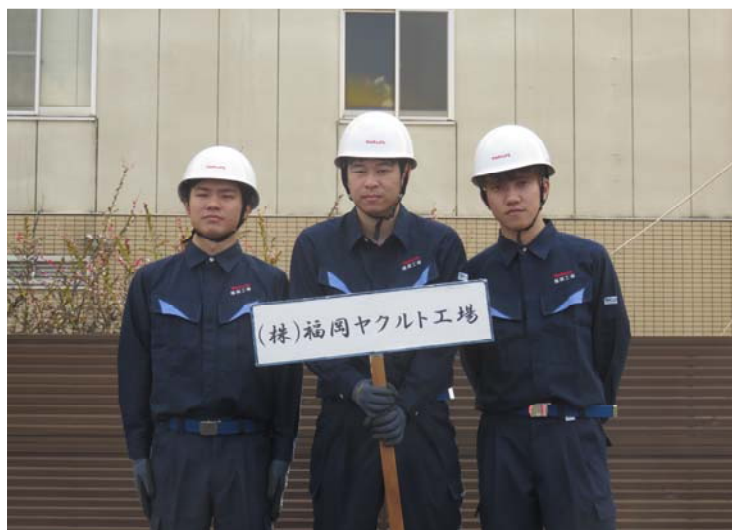
福岡ヤクルト工場