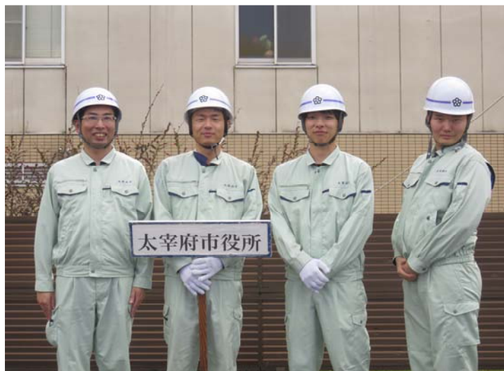
太宰府市役所(男子)