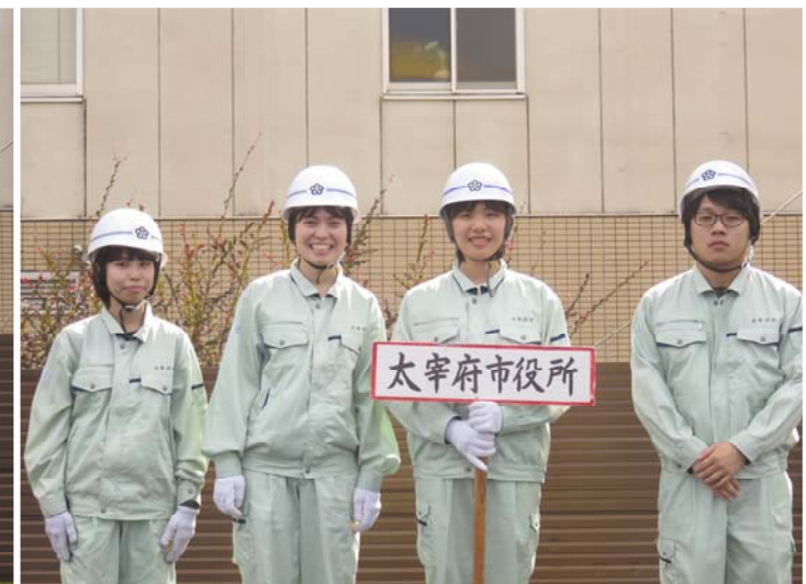
太宰府市役所(女子)