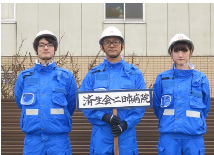
済生会二日市病院