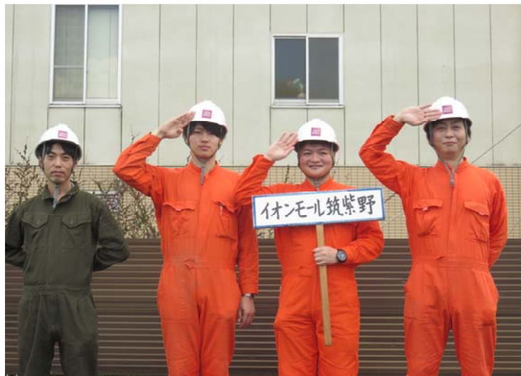
イオンモール筑紫野