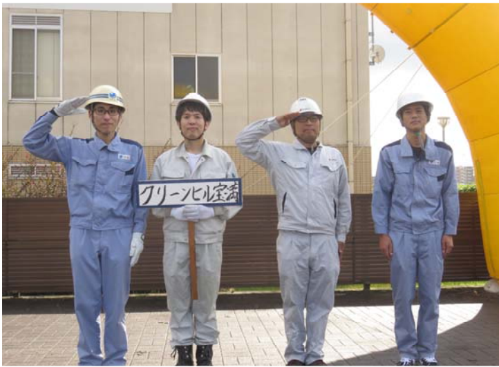
クリーンヒル宝満