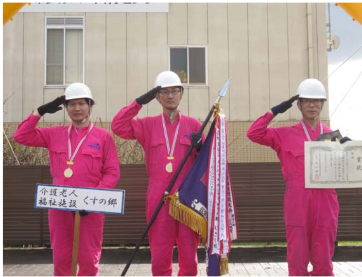
優勝 介護老人保健施設 くすの郷