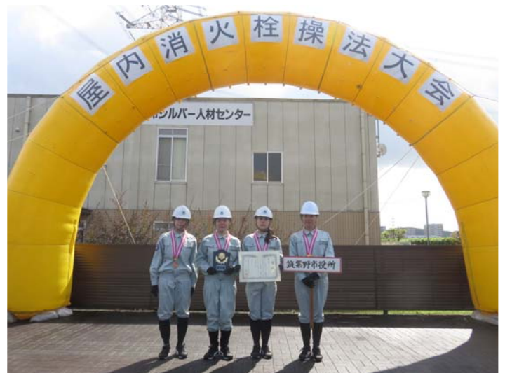
第3位 筑紫野市役所