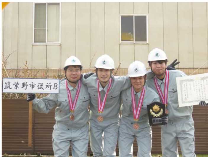
第3位 筑紫野市役所B