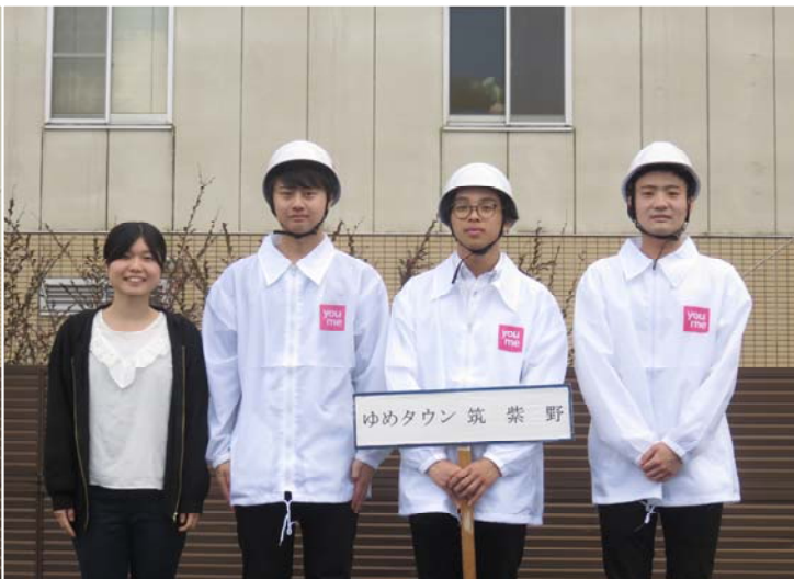
ゆめタウン筑紫野