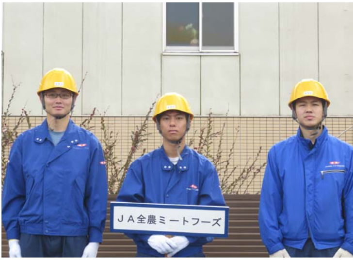
JA全農ミートフーズ