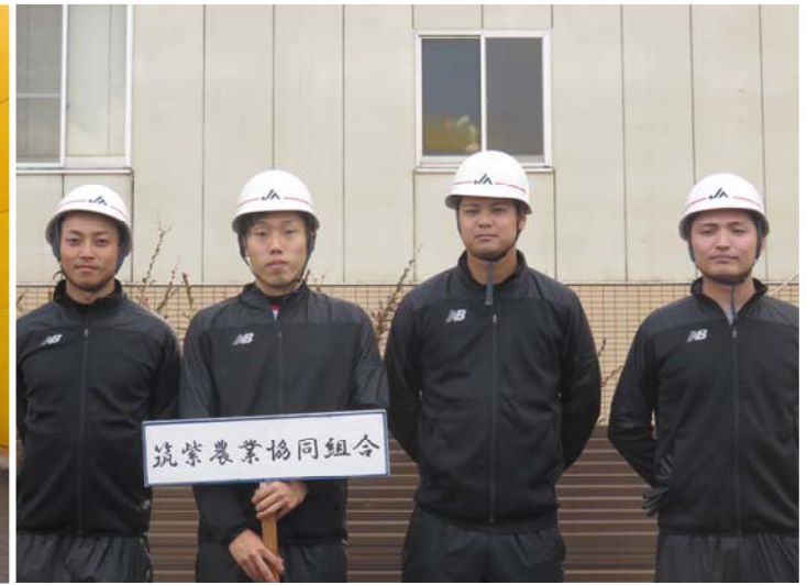
筑紫農業協同組合